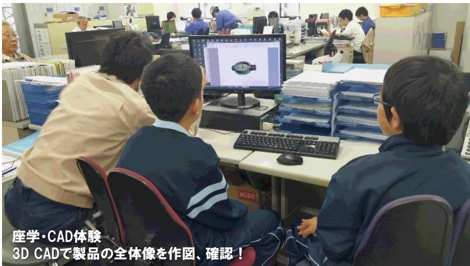
座学・CAD体験 3D CADで製品の全体像を作図、確認！