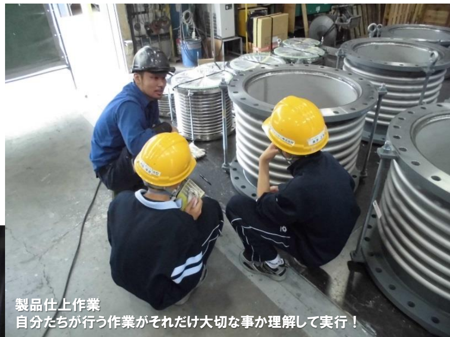
製品仕上作業 自分たちが行う作業がそれだけ大切な事が理解して実行！