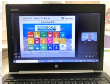
WEB講演【ウェビナー】 &WEB勉強会